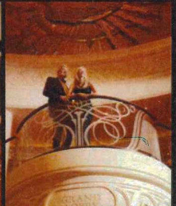
グランド・ロビー(イメージ)