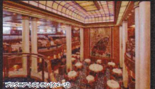
プラチミアレストラン(イメージ)

【別途費用】政府関連諸税13,767円、関西空港施設利用料3,040円、 燃油サーチャージ3,600円(2018年10月1日現在)