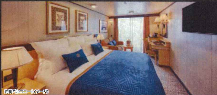
海側バルコニー(イメージ)