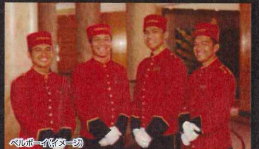
ベルボーイ(イメージ)