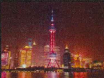
上海夜景(イメージ)