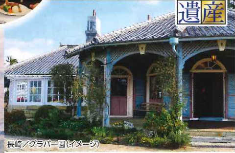
長崎/グラバー園(イメージ)