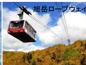
旭岳ロープウェイ